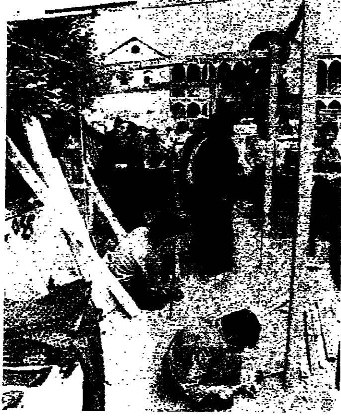
أحد أصحاب البسطات يصنع خيمة تقيه المطر